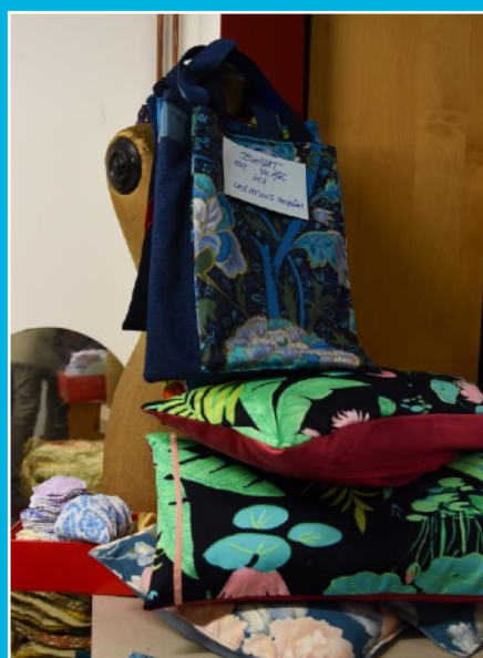
Frip'Art : Les créations uniques réalisées par l'atelier Frip'Art sont disponibles au magasin Frip'Art - La Recyclerie