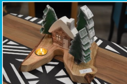
Recyclerie : Décorations de table réalisées en bois de palettes