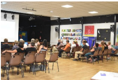
AG de la Régie de Quartiers - 16 septembre